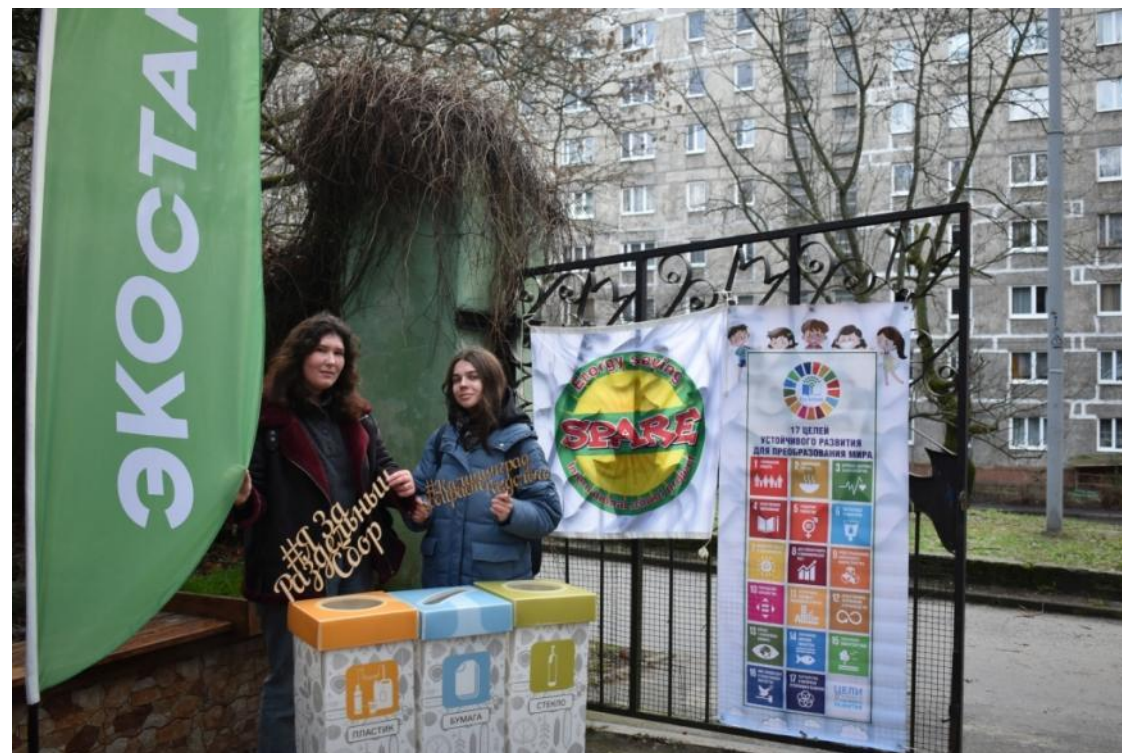
Фестивали сбора вторсырья «Мой Эковдор» в Калининграде