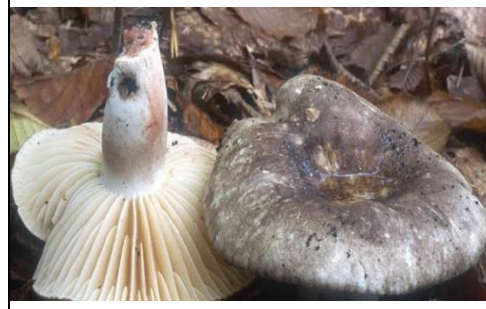
Подгруздок черный, чернушка