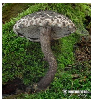
Шишкогриб (стробиломицес) хлопьеножковый