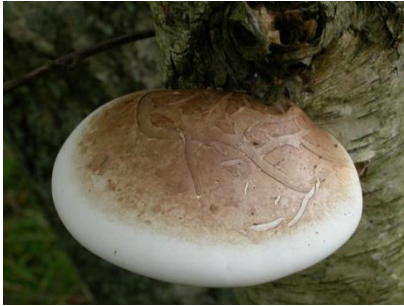
Березовая губка (трутовик березовый)