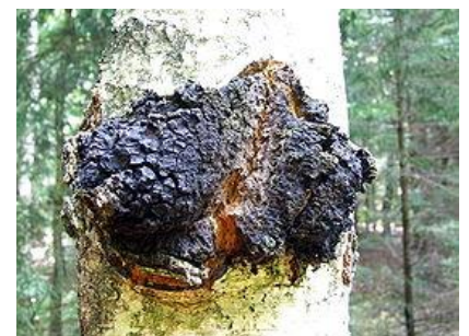
Трутовик скошенный, чага