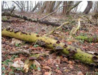
Аурикулярия уховидная, «Иудино ухо»