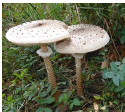
Гриб зонтик пёстрый, большой