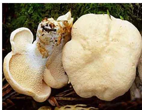
Ежовик желтый (гиднум выемчатый)